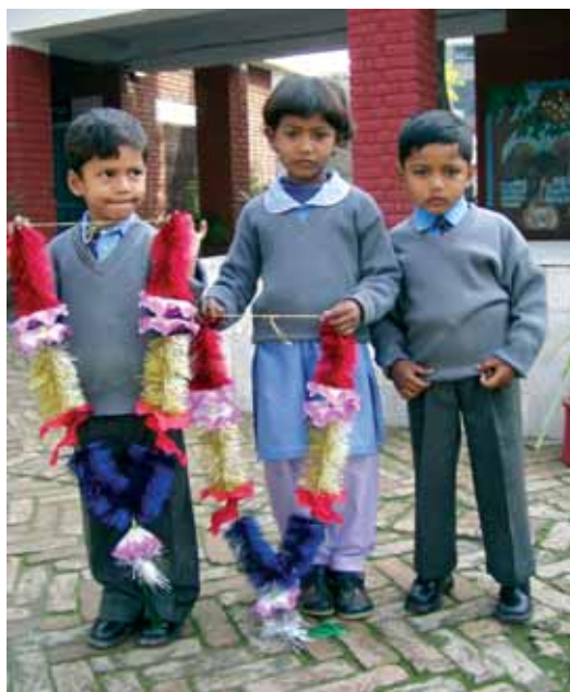
Tre drenge fra Mardan Skole, som kirken driver.