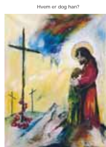
Hvem er dog han?