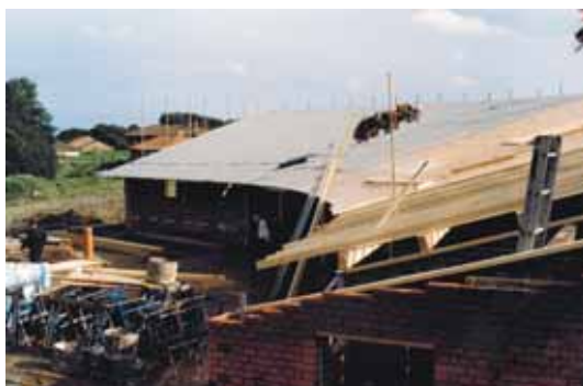
Rejsegilde på den ny præstegård

Søndag den 23. januar efter gudstjenesten