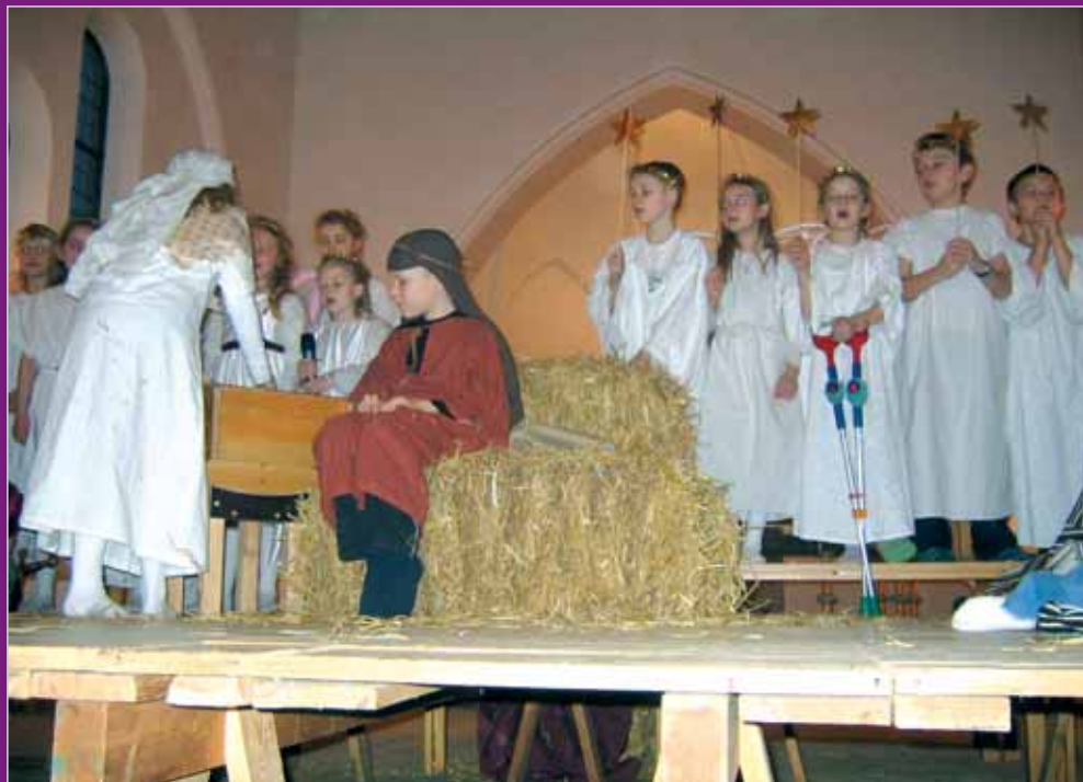
Skolens juleafslutning i kirken: Igen i år laver 2. klasse krybbespil

68. årgang, december 2006 - februar 2007