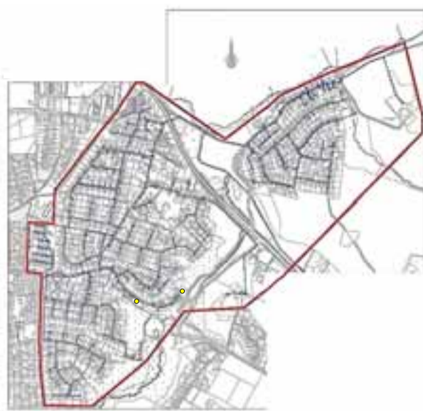
Tved Vands forsyningsområde

Denne indkaldelse er med forbehold for, om regeringen ændrer vilkårene for forsamling.