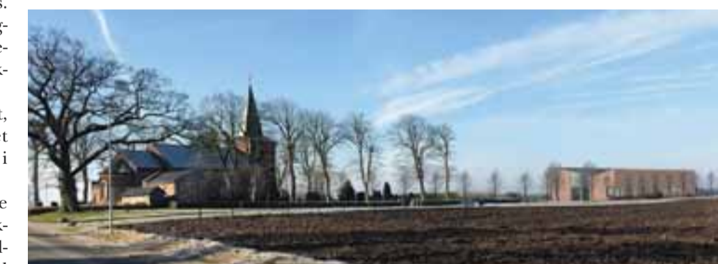
Det nye sognehus kommer til at ligge i forlængelse af den store – nordvendte – P-plads.

- Er vi nu sikre på, at der ikke er et 'men', som vi lige skal svare på først? Ja! Vi er sikre! Det er ganske vist. Nu kigger vi fremad – til første spadestik.