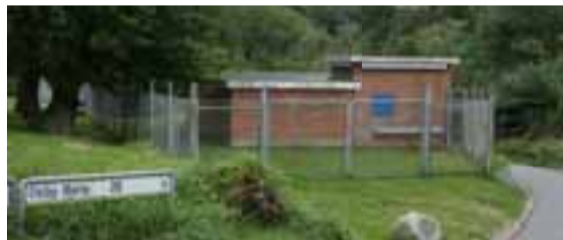
Vandværket, Tved Vand ligger på Ibyl

Tved Vandværks generalforsamling afholdes på: