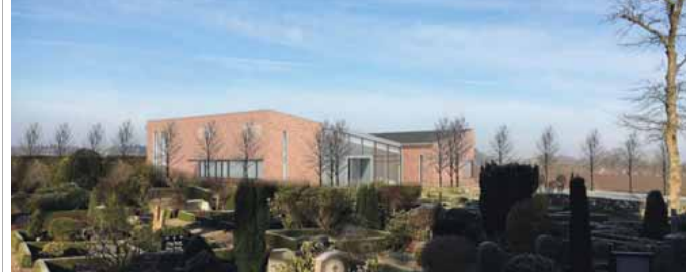
Kig til Dalby Kirkes nye sognehus, sådan som det kommer til at tage sig ud, når man står på trappen med ryggen til kirkens indgang. Se mere på side 5.