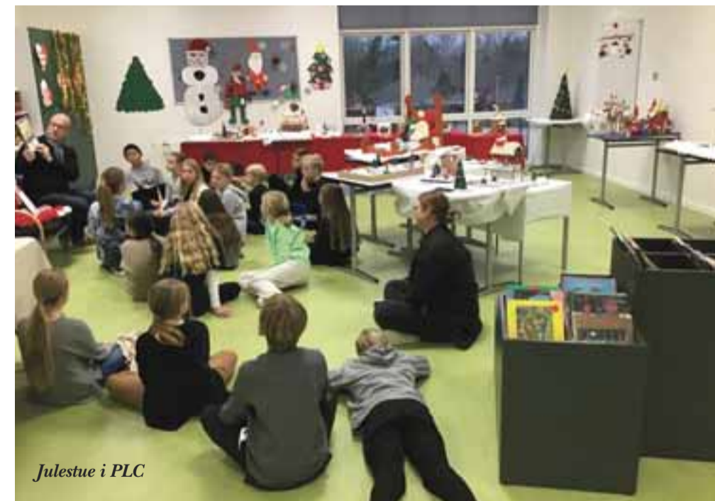
Julestue i PLC