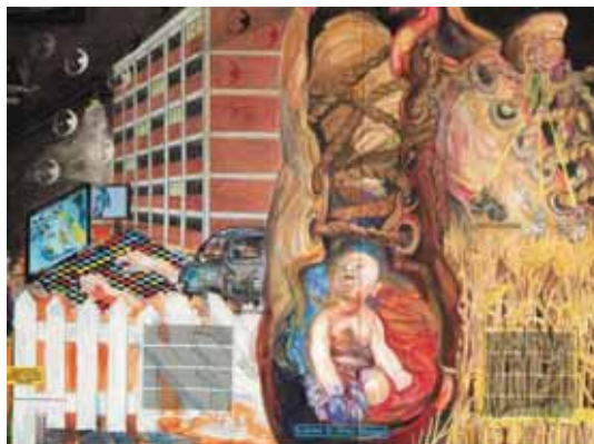
Et lille udsnit af Esbjerg-evangeliet.

Pris: Kr. 100,-. Afgang med bus fra præstegården kl. 13. Tilmelding senest mandag den 23. maj på opslag i kirken eller til Ellen Ravn på 75 52 08 72 (bedst efter kl. 16).