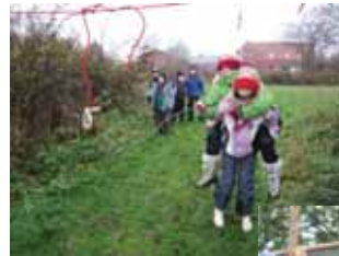
Spejdere lærer at samarbejde under svære betingelser.