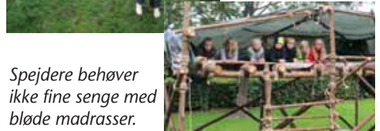
Spejdere behøver ikke fine senge med bløde madrasser.