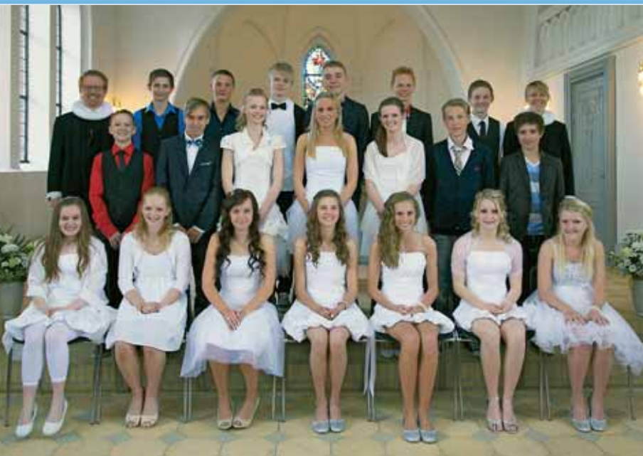
Dalbys konfirmander 2011 Se deres bøn side 8